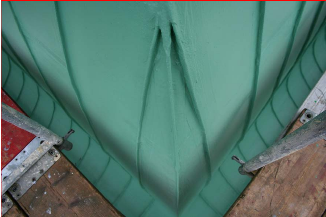
sehr anspruchsvolle Detail – Abdichtungen