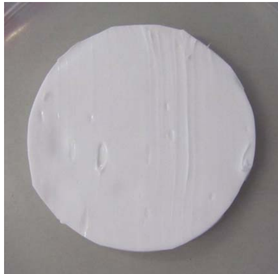
Foto 1: Untersuchungsmaterial PCI Silcofug E, Farbe brilliantweiß nach einer Inkubationszeit von 28 Tagen ohne sichtbaren Pilzbewuchs