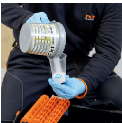
Alternativ kann auch PCI Durapox Finish (Konzentrat) MV 1:100; 5l Wasser; 50 g Durapox Finish; direkt in das Waschwasser hinzugegeben werden.