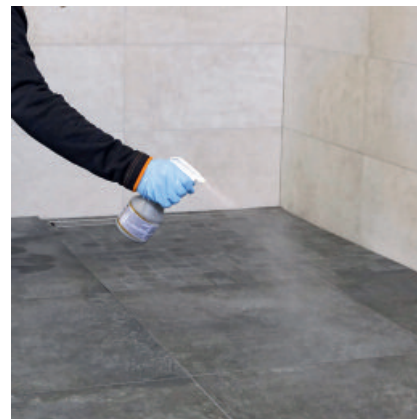
Vor dem finalen Waschgang wird nach ca. 60 Min. PCI Durapox Finish (flüssig) auf die Fläche aufgesprüht.