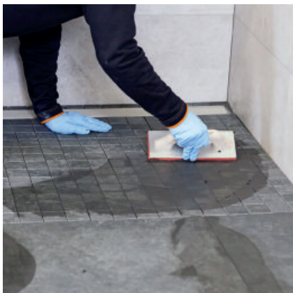
PCI Durapox Premium mit einer Hartgummischeibe in die Fugen einbringen.