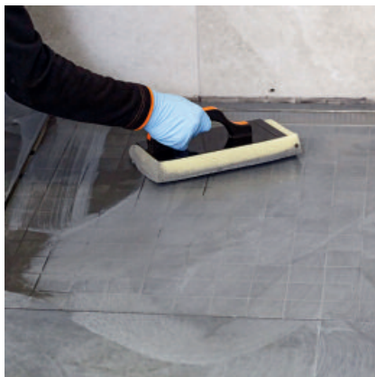
Nach ca. 10 - 45 Min. die eingefugte Fläche mit einem Schwammbrett anemulgieren und sauber abwaschen.