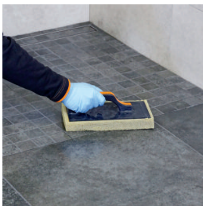
Anschließend mit dem Schwammbrett den Restschleier aufnehmen und die Fläche sauber waschen.