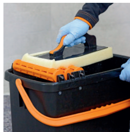
Wichtig dabei ist, dass das Waschwasser in regelmäßigen Abständen (ca. 5 - 10 m 2 ) gewechselt wird.