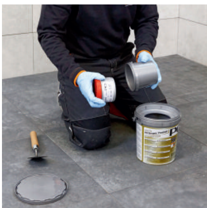
PCI Durapox Premium (2 kg) öffnen und die zweite Komponente herausnehmen.

Angemischten Epoxidharz-Fugenmörtel auf die zu verfugenden Beläge auftragen, mit PCI Gummifugscheibe einschlämmen und diagonal abziehen.