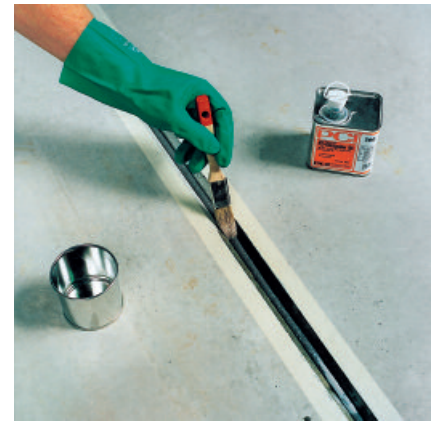
Vor dem Verfugen die gereinigten Fugenflanken mit PCI Elastoprimer 110 bis zur Sättigung mit einem Pinsel grundieren. Nach einer Abluftzeit von min. 50 Minuten und max. 2 Stunden...