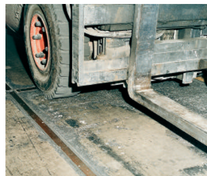
PCI Elritan 140 für Bodenfugen in Industrie- und Lagerhallen.