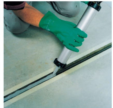
...die Bodenfugen mit PCI Elritan 140 schließen.