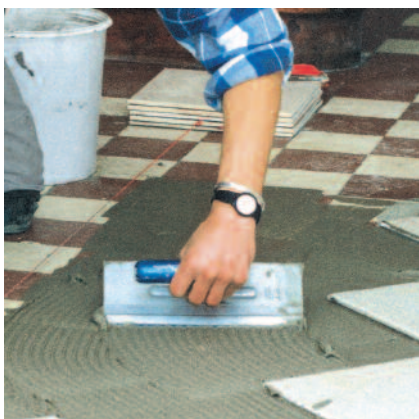
Nach ca. 30 bis 45 Minuten können nachfolgende Oberbeläge mit PCI-Fliesenklebern aufgebracht werden.