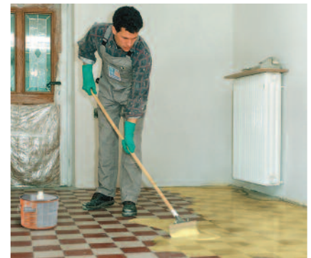
PCI Gisogrund 303 ist die sichere Haftgrundierung zum Verlegen von Belägen auf keramischen Fliesen und Platten.