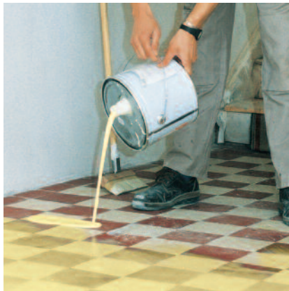
PCI Gisogrund 303 gründlich aufschütteln und auf den Untergrund ausgießen.

2 Grundierung z. B. mit Flächenstreicher, weichem Haarbesen oder Quast auf dem Untergrund verteilen und im „Kreuzgang dünn auftragen. Pfützen vermeiden!“ (Verbrauch: ca. 90 bis 130 ml/m 2 ).