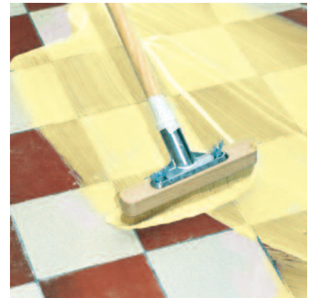
Grundierung auf dem Untergrund im „Kreuzgang“ vollflächig verteilen.

3 PCI Polycrret 5 bzw. PCI Pericret oder PCI-Fliesenkleber zur Verlegung von keramischen Fliesen- und Plattenbelägen auf die abgelüftete und ausgehärtete Grundierung aufbringen!