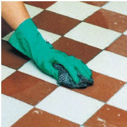
Untergrund mit geeignetem Reiniger von haftungsmindernden Rückständen säubern.

1 PCI Gisogrund 303 gründlich aufrühren bzw. aufschütteln.