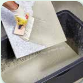
... quasten ...