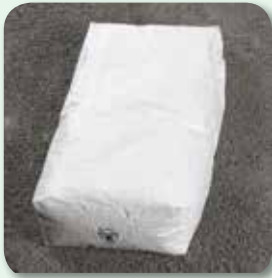
Unterbau, Tragschichten und Bettung vorbereiten