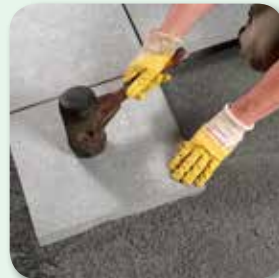
Verlegung „frisch in frisch“