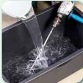
5 bzw. 7 l Wasser vorlegen