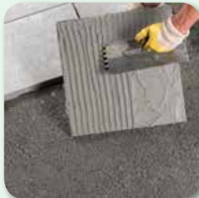
oder mit dem Zahnpachtel auftragen.